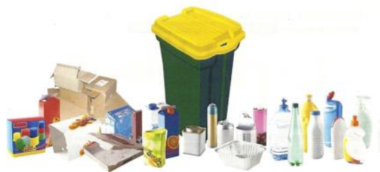
Bouteilles et flacons plastiques, cartons, conserves, canettes, briques alimentaires.