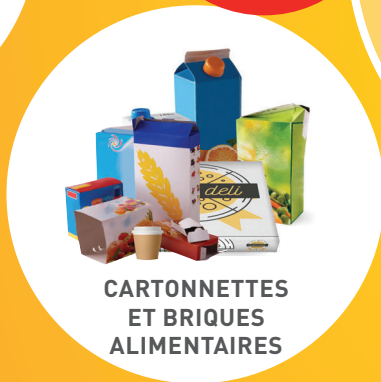
CARTONNETTES ET BRIQUES ALIMENTAIRES

ATTENTION : CHANGEMENT DES CONSIGNES DE TRI AU 1 ER JANVIER 2023