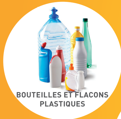
BOUTELLES ET FLACONS PLASTIQUES

ATTENTION : CHANGEMENT DES CONSIGNES DE TRI AU 1 ER JANVIER 2023