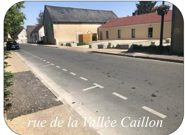
rue de la Vallée Caillon

La rénovation des trottoirs en béton désactivé de la rue de la Vallée Caillon n'est pas terminée. Dans la partie déjà réalisée, une zone a été volontairement laissée en attente pour permettre la pose d'une chambre télécom par Orange pour le raccordement à la fibre de la nouvelle pharmacie. Les trottoirs restants seront faits quand la chambre télécom sera posée.