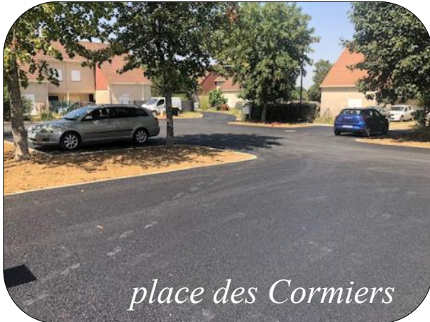
place des Cormiers

L'engazonnement des espaces verts sera réalisé quand les conditions météorologiques seront plus favorables.